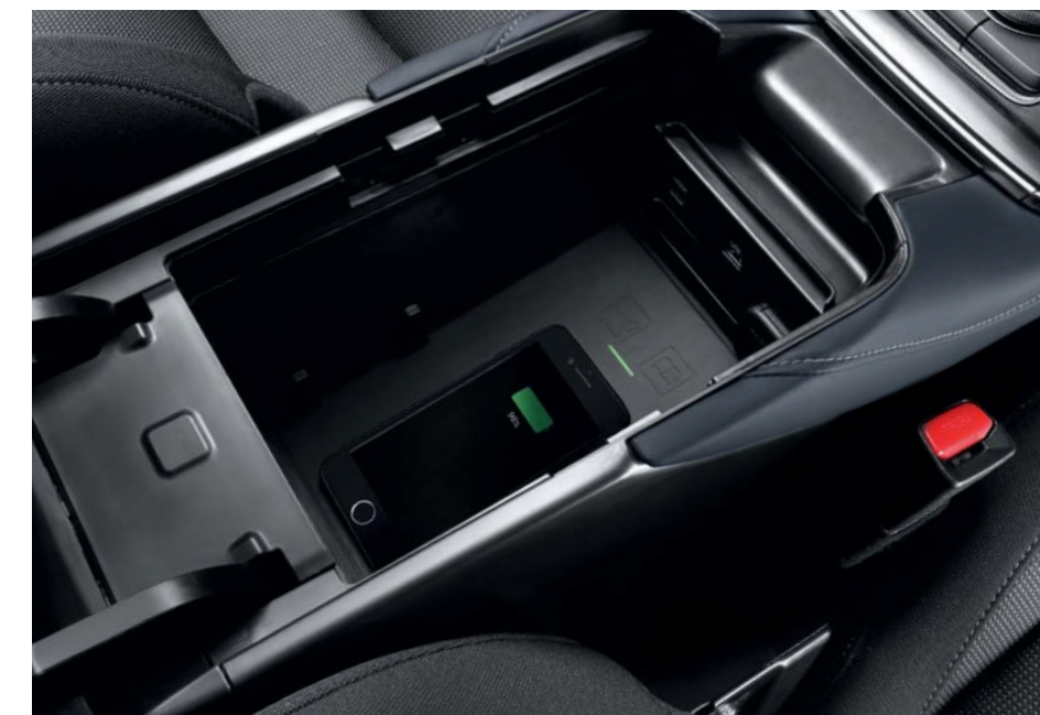
Bezdrátové nabíjení mobilního telefonu