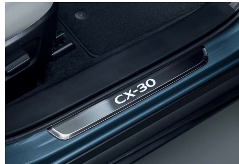
Osvětlené prahové lišty

Mazda vytvořila důmyslně navržená příslušenství, která 2021 Mazdu CX-30 dokonale doplňují. Máte-li zájem o kompletní seznam originálních příslušenství Mazda, navštivte naše webové stránky.