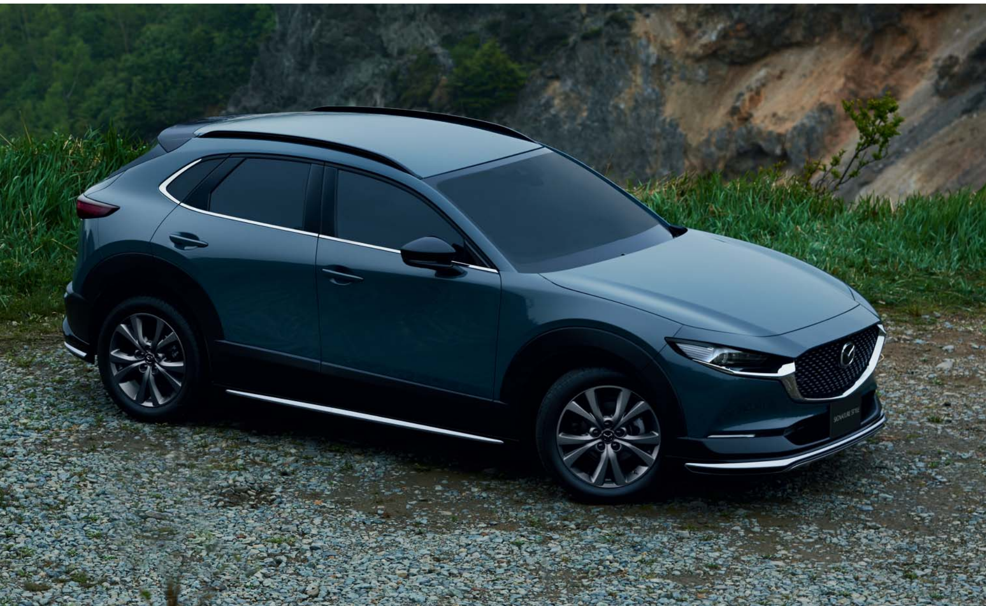
Kit Aero a střešní lišty