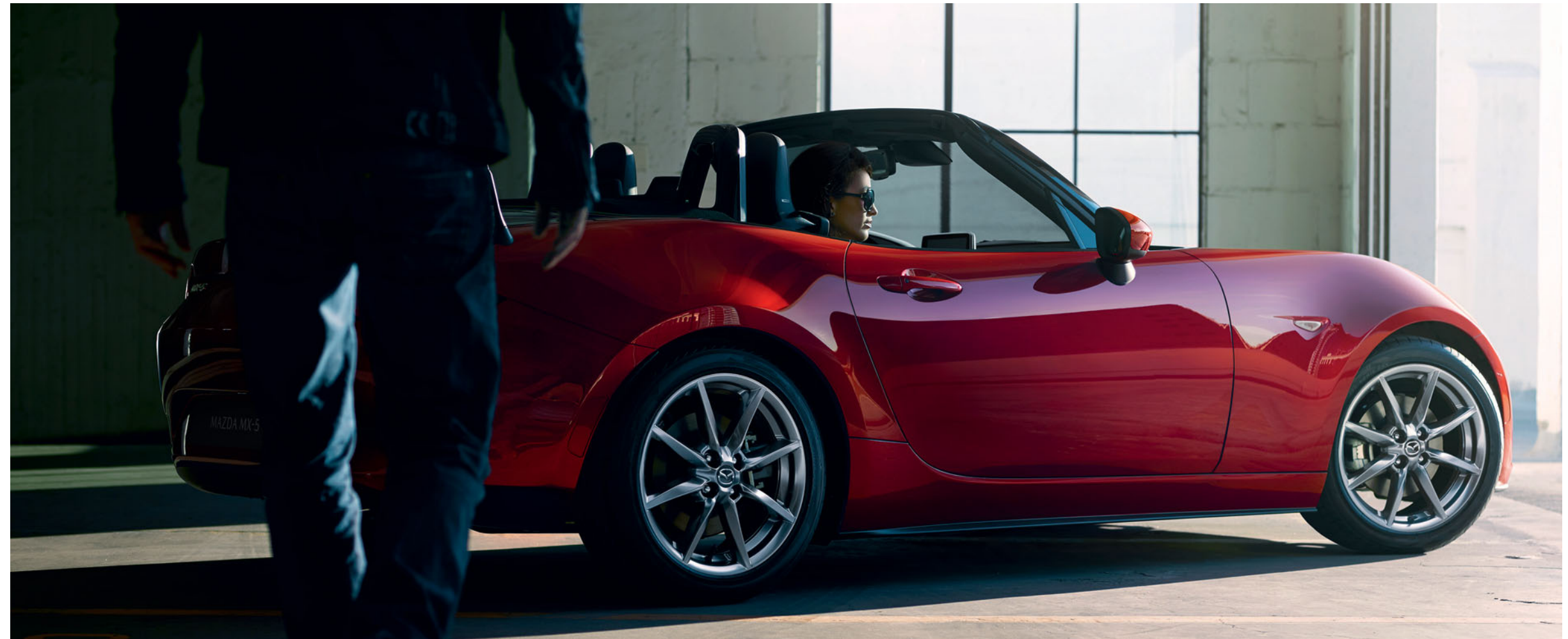
Mazda MX-5 v barvě Soul Red Crystal

Vyhýbat se nehodám v prvé řadě je vždycky tou nejbezpečnější cestou. Řada sofistikovaných a inovativních bezpečnostních prvků i-Activsense vás upozorní na nebezpečí a pomůže vám vyhnout se nehodám – nebo alespoň snížit jejich dopad. Funkce jako systém sledování mrtvých úhlů nebo systém varování před neúmyslným opuštěním jízdního pruhu zlepši vaši viditelnost a povědomí o dění na silnici. Když to bude potřeba, některé i-Activsense inovace dokáží i samy zabrzdit. Můžete se tak v klidu soustředit na řízení a užít si každou jízdu.